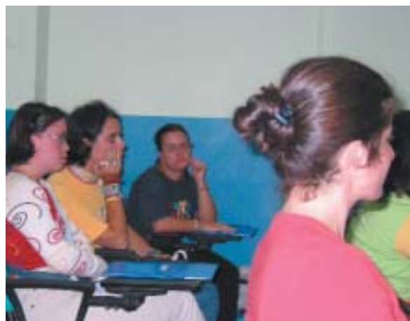
Jóvenes asistentes a la presentación