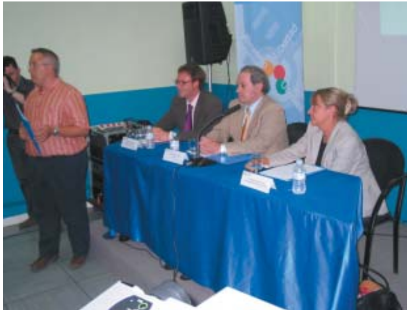
El director de la Escuela de Voluntariado de Madrid, dio la bienvenida a los asistentes

http://www.sindromedown.net/documentos/voluntariado