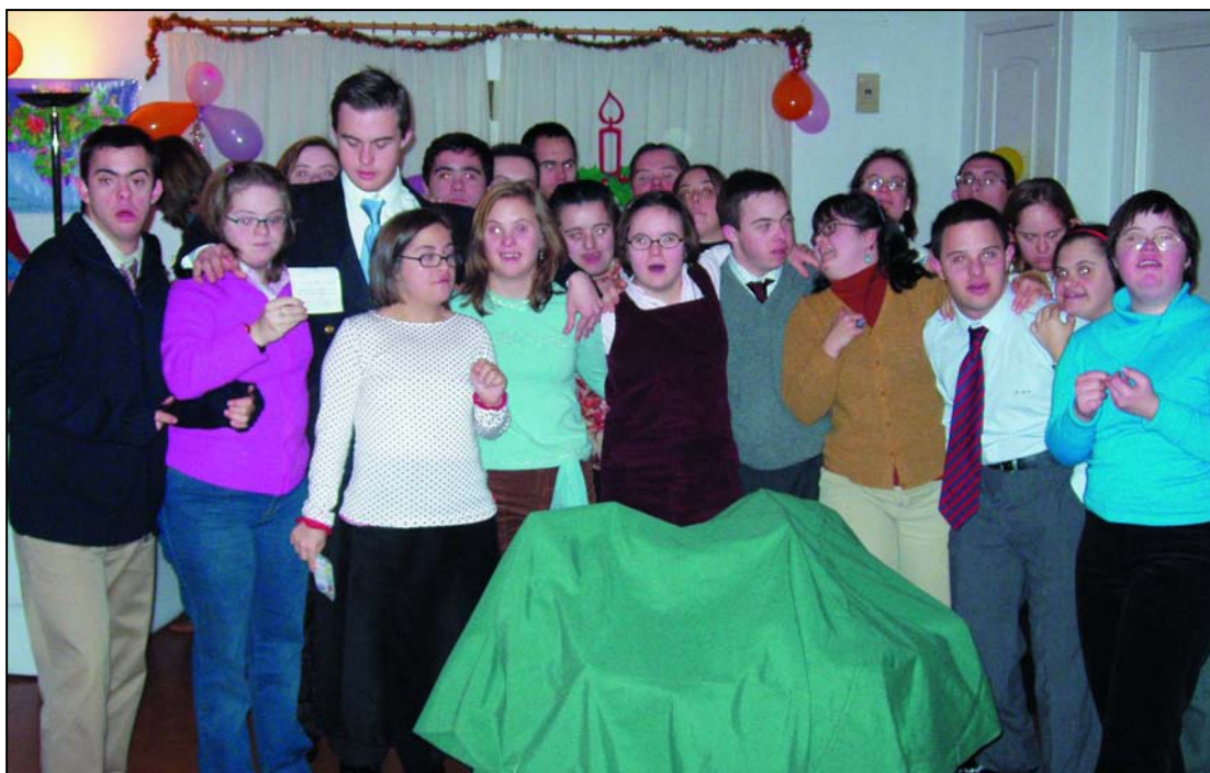
Preparando el Rigodón

mento se propone que la Educación Infantil vuelva a abarcar de los 0 a los 6 años y que tenga finalidad educativa y carácter voluntario, además de gratuita en el 2º ciclo (3-6 años).