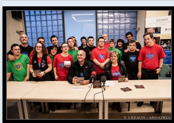
El grupo al completo acudió a la presentación del disco.