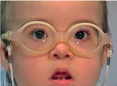
Figura 2: Corrección con gafas de un defecto refractivo