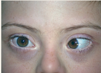
Figura 3: Endotropía del ojo izquierdo en una niña con síndrome de Down